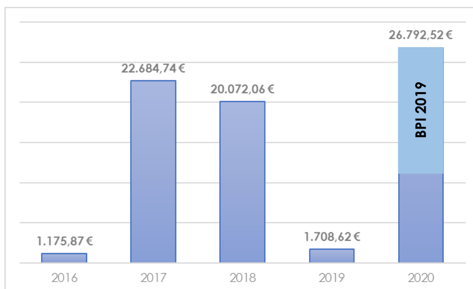
Gráfico 1 - Evolução dos resultados de 2016 a 2020

Os custos do exercício foram de 26.724,43 euros (vinte e seis mil, setecentos e vinte e quatro euros e quarenta e três cêntimos) bastante inferiores em relação ao ano precedente: 41.972,17 euros (quarenta e um mil, novecentos e setenta e dois euros e dezassete cêntimos). A redução de custos prende-se sobretudo com a alteração da atividade associada aos Campos de Férias com franca redução do custo destes (incluindo nas rúbricas de seguros, material e transporte).